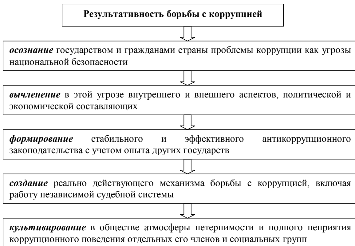
Схема 2. «Цепочка результативности» борьбы с коррупцией

Вместе с тем международный опыт борьбы с коррупцией показывает, что успех в ней зависит от целого ряда факторов, но в целом своеобразная «цепочка результативности» может быть представлена следующим образом (см. схему 2).